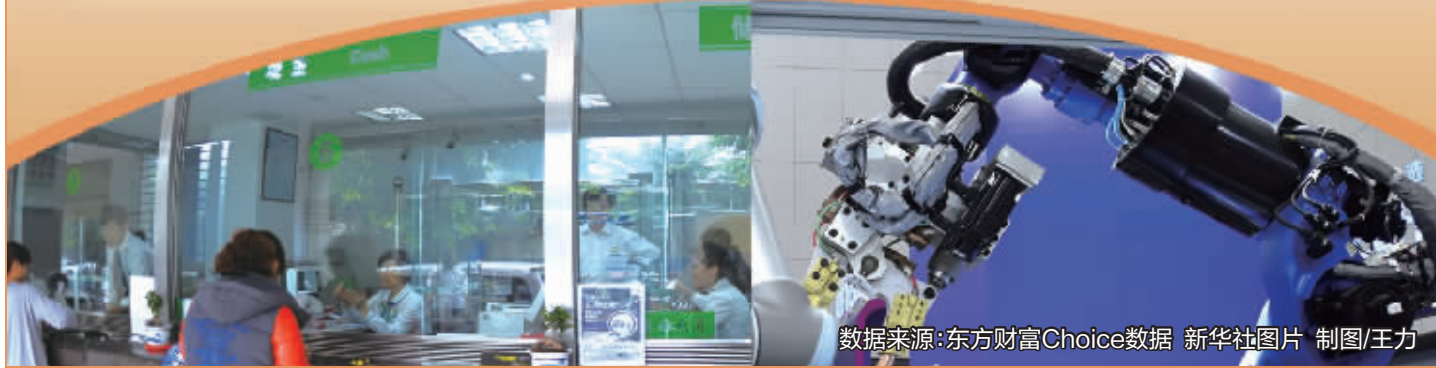
数据来源:东方财富Choice数据 新华社图片 制图/王力