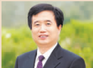
李开民 中国卫星董事长