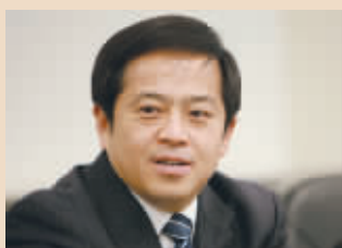
向文波 三一重工总裁