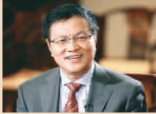
董文标 民生银行董事长