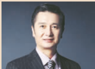
孙亮 山东高速董事长