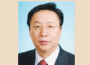
孙兆学 中金黄金董事长