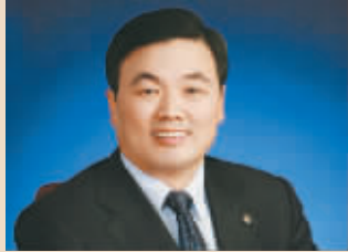
胡怀邦 交通银行董事长