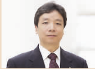
陈玉民 山东黄金董事长