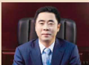
肖世杰 国电南瑞董事长