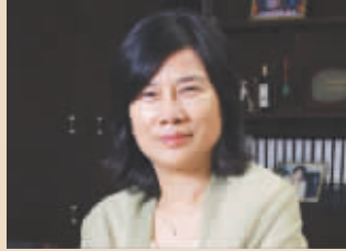
董明珠 格力电器副董事长、总裁