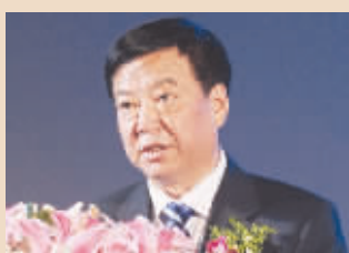
张建华 中国国旅董事、总裁