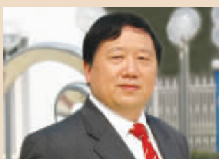
俞学锋 安琪酵母董事长