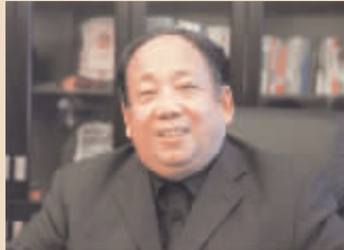
安康 华兰生物董事长