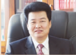
杜建华 山煤国际董事长