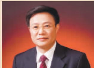
李长进 中国中铁董事长