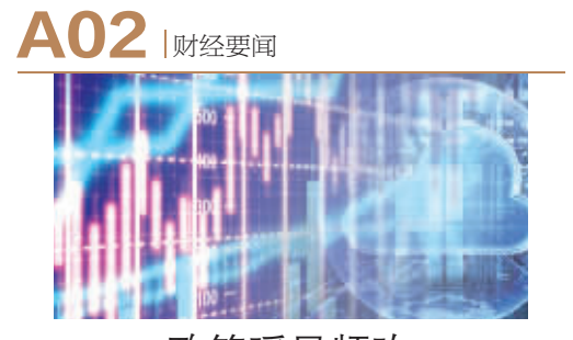
政策暖風頻吹 併購重組迎來機遇期

● 本報記者 劉麗靚 12月25日至26日，國務院國資委召開中央企業負責人會議，總結2023年國資央企工作，研究部署2024年重點任務。國務院國資委黨委書記、主任張玉卓表示，要圍繞增強核心功能、提高核心競爭力，深入實施國有企業改革深化提升行動，着力提高中央企業創新能力和價值創造能力，推動國有資本“三個集中”，加快建設現代化產業體系、實現高質量發展，更好發揮科技創新、產業控制、安全支撐作用。 前11月央企實現利潤2.4萬億元 會議指出，2023年，中央企業價值創造導向更加鮮明，1至11月實現利潤總額2.4萬億元，累計完成固定資產投資4.1萬億元、同比增長9.1%，研發經費投入9000多億元、同比增加近700億元，企業發展質量更優、基礎更實；現代化產業布局全面加速，戰略性新興產業和未來產業布局力度空前，傳統產業升級改造提速提質，重要能源資源保障不斷強化；科技創新力度明顯加大，企業科技創新主體地位、創新體系建設、創新成果產出持續加強；國有企業改革深化提升行動啟動實施，重點改革任務加快落地，監管服務效能不斷提升；（下轉A03版）